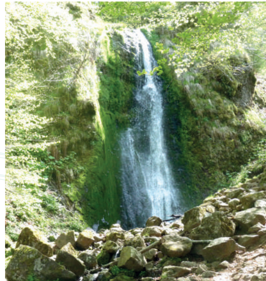
↑↑ Cascade de Pérouse